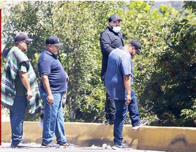
Creditos de fotos: Pérez Rico: Alejandro Gutiérrez Mora/ZETA San Quintín, Lorena Lamas/ZETA. Cartel de la línea y Jaime Bonilla: Cortesía