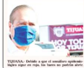
TIJUANA.- Debido a que el semáforo epidemiológico sigue en rojo, los bares no podrán abrir.

TIJUANA.- EL XXIII Ayuntamiento tijuano que mientras la Secretaría de Salud en Baja California indica que el serraduro epidemiológico permanece en rojo, los bares de la ciudad deberán estar cerrados.